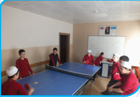
MASA TENİSİ TURNUVAMIZ