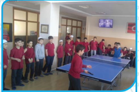
MASA TENİSİ TURNUVAMIZ