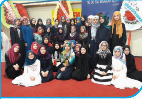
YIL SONU PROGRAMIMIZ