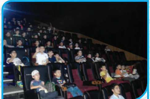
SİNEMA ETKİNLİĞİMİZ - 2