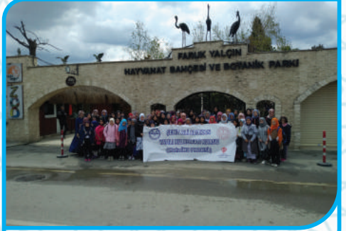
DARICA HAYVANAT BAHÇESİ