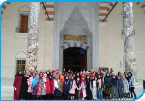
ÇAMLICA CAMİİ ZİYARETİMİZ